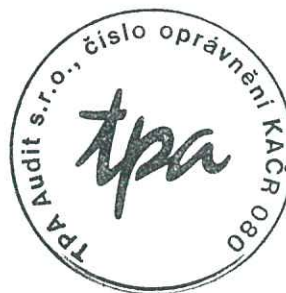
TPA Audit s.r.o. Antala Staška 2027/79, Praha 4 číslo oprávnění 080 KAČR